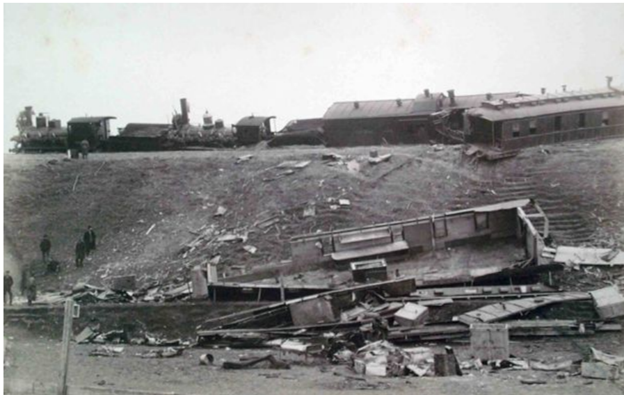
фотография А.М. Иванецкого

Задание 14. (ответ на данное задание оценивается в рамках Олимпиады школьников «В мир права» и одновременно в рамках Конкурса олимпиадных работ школьников на призы Следственного комитета Российской Федерации)